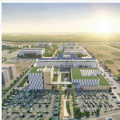
Hôpital Universitaire International - Rabat