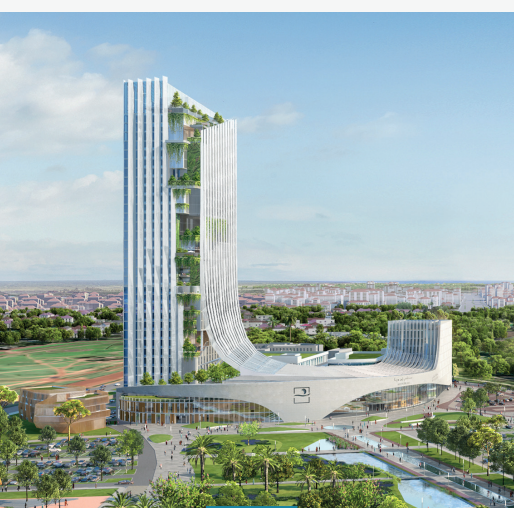
CHU Ibn Sina - Rabat

Le carnet de commandes du groupe s'élève à près de 7,55 Milliards de Dhs en progression de 16,1% par rapport au 31/12/2022. La part à l'export représente 43 % du portefeuille avec des implantations dans plusieurs pays Africains.