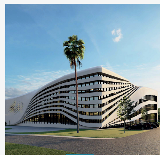
Extension FRMF - Rabat